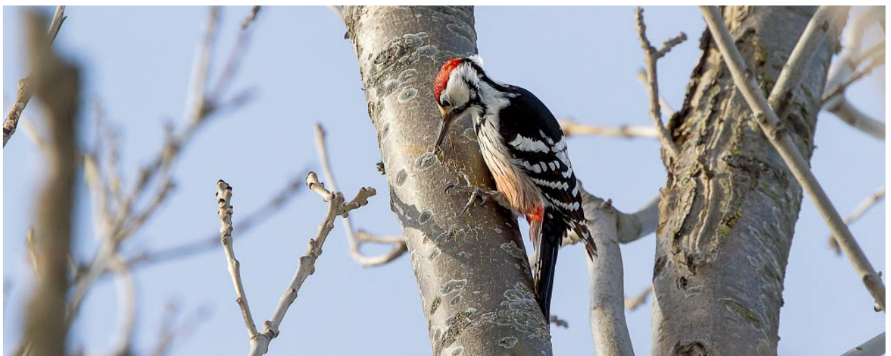
Valkoselkätikka.