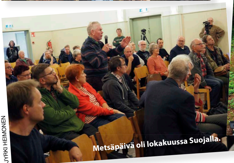
Metsäpäivä oli lokakuussa Suojalla.