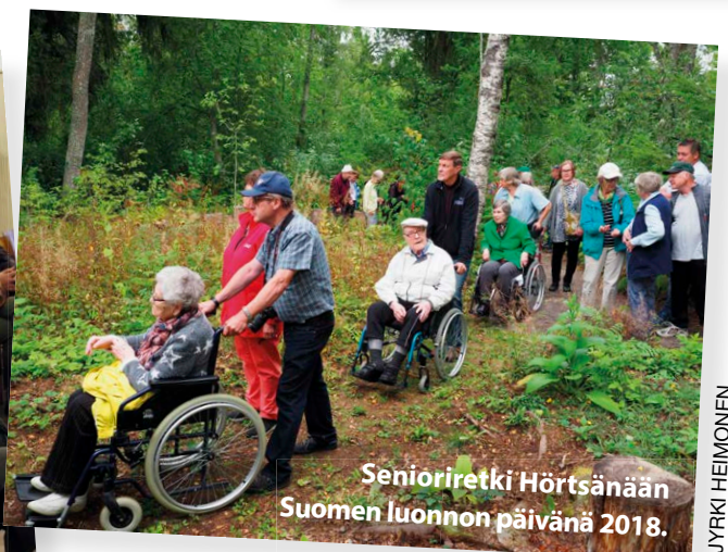
Senioriretki Hörtšanään Suomen luonnon päivänä 2018.